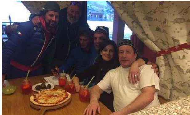
La «Fiocco di neve» di Montecampione conquista la nuova leadership provvisoria a livello provinciale

va lanciata da Bresciaoggi che permette ai lettori di esprimersi votando il proprio posto del cuore e della gola) ora è il «Fiocco di neve» di Montecampione. Seguono, sul secondo gradino del podio, «Piz Bon» di Edolo e «Prati Verdi», mentre «Da Maddalena» scivola al quarto posto. Per il resto è bagarre totale: pochi voti più indietro «Vesuvio» di Desenzano del Garda, «La Torretta Ro'» di Montichiari e l'«Oasis» di Leno, in settima piazza. Poi la graduatoria vede somitare per un posto al sole «Ezio» di Lonato del Garda, «Crotte» in città, «Exotic» di Manerba del Garda e «Amalfitana» di Flero. Appena fuori dalla top ten della classifica provvisoria «Le stess» di Borno, «Risto Pizzaboy» di Montichiari, «Piccolo Lord» di Piombino e un trio di pizzerie cittadine: «Europizza», «La Bussola» e «Olimpo». E ora sta per arrivare il bonus in grado di rivoluzionare nuovamente la classifica: il tagliando da 25 punti che tutti i lettori-giurati troveranno sul giornale di mercoledì. Per da-