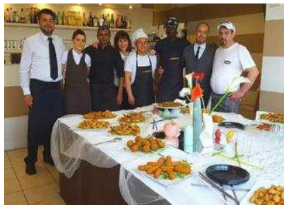
«Da Maddalena» perde il primato, ma rimane ancora sul podio