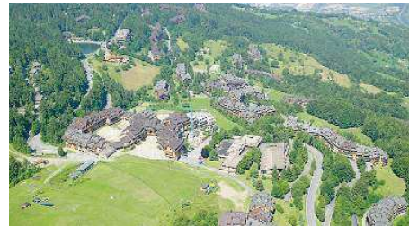
In attesa. Continua il braccio di ferro Comune-Consorzio