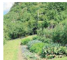
Genuinità. Uno orto... da premio

■ Una tradizione e un piacere, ma anche un hobby e un modo per garantirsi prodotti genuini: la coltivazione dell'orto da qualche anno in Valle è divenuta anche un concorso. Il premio per il miglior orto alpino, indetto dal Parco dell'Adamel-