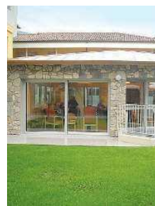
Rsa. Il corso inizia a Esine

■ Ci sono ancora pochi giorni per iscriversi al corso di formazione «Amministrare il bene Comune. L'abc dell'ente locale», organizzato dalle Acli di Valcamonica sia per chi è già impegnato nelle Amministrazioni comunali sia per chi intende approfondire la sua preparazione in vista di un impegno futuro. Le lezioni si svolgono il sabato, dalle 9 alle 12 (al termine il pranzo), ogni volta in un Comune diverso, con relatori sindaci, assessori e funzionari pubblici esperti in gestione degli enti locali.