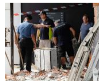
Il luogo dell'esplosione a Mazzano

Il terribile boato è stato avvertito a distanza di chilometri la notte scorsa a Mazzano, dopo che alcuni malviventi hanno fatto esplodere il postamat in viale della Resistenza. La deflagrazione ha reso completamente inagibile l'ufficio postale, ma il colpo è andato a vuoto. Il bottino contenuto nella cassaforte è infatti rimasto sepolto sotto le macerie.