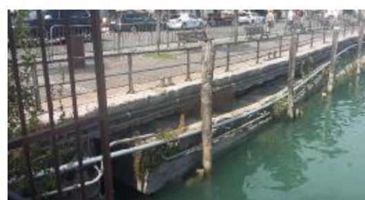
La passeggiata sul lungolago di Desenzano sprofonda

L'improvviso collassamento della massicciata ha provocato da ieri la chiusura di un tratto della passeggiata sul lungolago di Desenzano. Il cedimento riguarda il segmento di tragitto compreso fra la biglietteria e gli uffici di Navigarda. La zona è stata transennata e vietata al transito in attesa degli accertamenti tecnici ordinati dall'Amministrazione comunale.