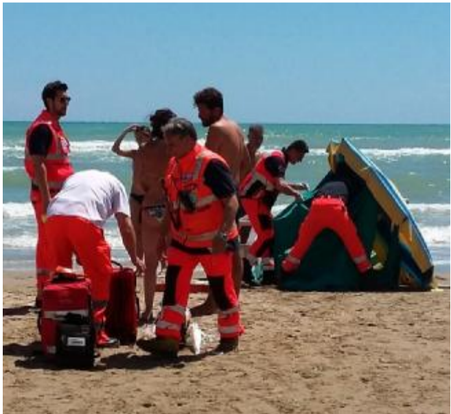
Inutili i tentativi dei soccorritori di rianimare il 44enne