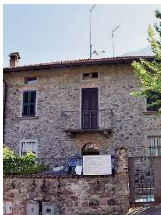
Prospettive. La «Casa di Zaccaria»

■ Tra vicoli e cortili, tra «arti, mestieri & sapori» di Fucine, nasce l'associazione «Casa di Zaccaria» e la nuova casa per i gruppi del paese. Sboccia la voglia di fare comunità nella frazione darfen-