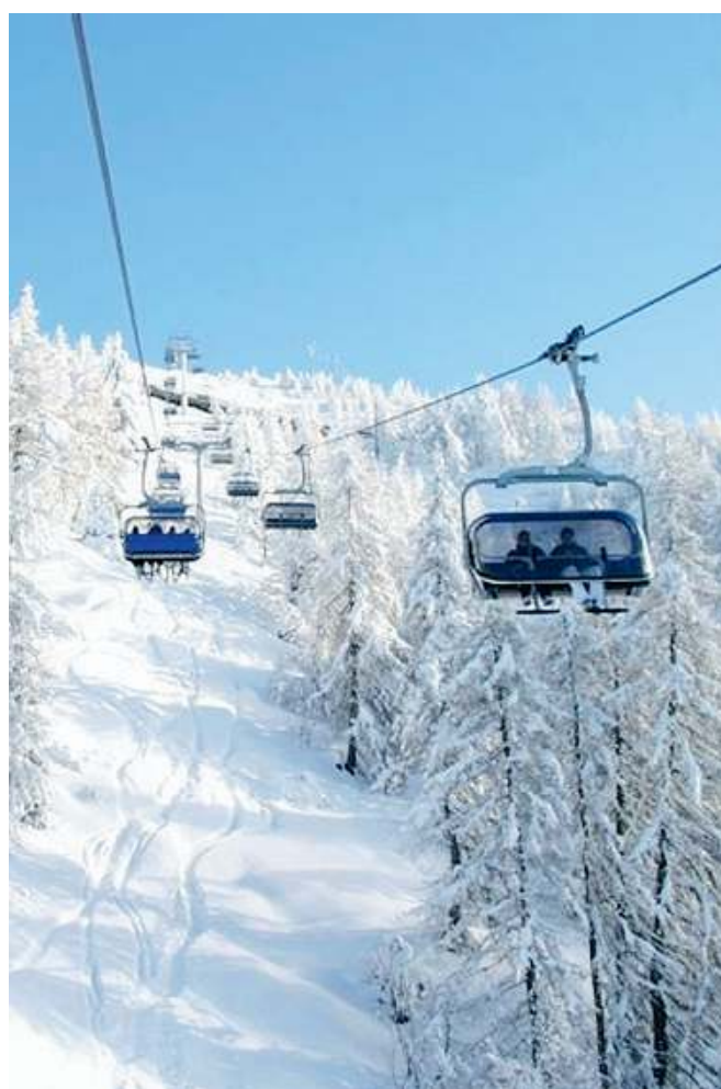
Sulla neve. Spiragli per il futuro del comprensorio di Montecampione

qualcosa di più: su 2.400 appartamenti, hanno aderito alla ricapitalizzazione soltanto in duecento. Per chi ha detto «no» all'operazione, lo skipass stagionale sarà a prezzo pieno. //